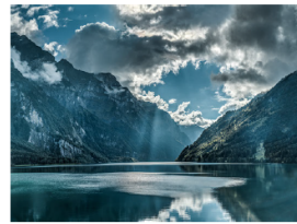
KWC Swiss Water Experie... 02