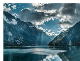
KWC Swiss Water Experie...