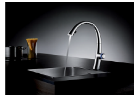
03a_KWC ZOE TLP_1113...