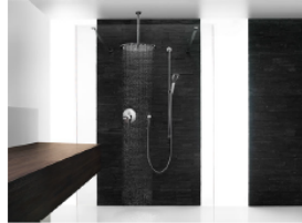
05_KWC ZOE BAD_11043...