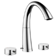
07_KWC ZOE 3-Loch m.A...