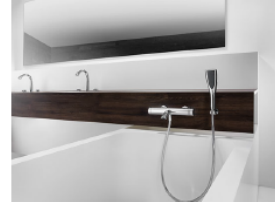
06_KWC ZOE Bad_11044...