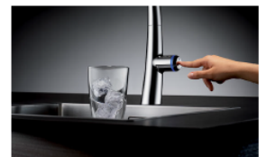
03b_KWC ZOE TLP_1114...