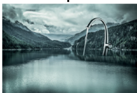
01_KWC ZOE lmg_11055...